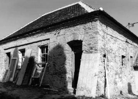
Geburtshaus – Birthplace