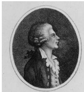
Jugendbildnis Ignaz Joseph Pleyel