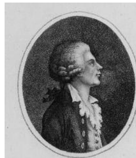
Jugendbildnis Ignaz Joseph Pleyel

Am 18. Juni 1757 erblickt im kleinen niederösterreichischen Weinort Ruppersthal das jüngste und insgesamt 8. Kind des Schulmeisters, Regenschori und Mesners Martin Pleyel und seiner