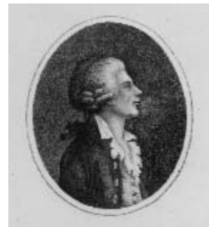
Jugendbildnis Ignaz Joseph Pleyel