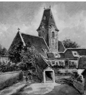
Pleyels Taufkirche mit seinem Geburtshaus in Ruppersthal/NÖ, Niederösterreichische Landesbibliothek, topografische Sammlung

Concertante for string trio and orchestra K. 320e in favour of the Sinfonia Concertante for violin, viola and orchestra K 364. Among the composers of the generation that followed one might mention Hummel's Double Concerto for violin and piano and Beethoven's Triple Concerto, which had been composed in connection with the master's projected move to Paris.