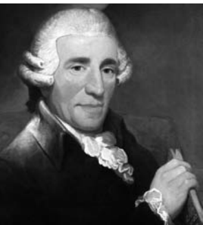
Franz Joseph Haydn (1732–1809), Gemälde von Thomas Hardy (1757–1805)

Pleyel's "star" began to shine particularly brightly during his Strasbourg period. His fame as a composer reached extraordinary heights there. Everything that flowed from his pen was repeated endlessly. Mendel wrote, "In Vienna, Paris, Berlin, Leipzig, London and Holland, his compositions were so popular that it seemed as though no-one at the time had heard of any other composers." In Strasbourg Pleyel wrote the symphonies full of lovely melodies which even then made him the most popular composer in Central and Western Europe. But there was more: Pleyel also became the driving force behind the concerts in the new Mirror Hall and his compositions were highly acclaimed – he became the musical soul of Strasbourg.