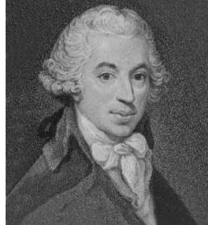
Ignaz Joseph Pleyel (1757–1831), Gemälde von Thomas Hardy (1757–1805)

Wenn man in den letzten Jahrzehnten von der klassischen Sinfonie ab Mitte des 18. Jahrhunderts sprach, wurde dieses Thema vornehmlich mit den Komponisten Franz Joseph Haydn (1732–1809), Wolfgang Amadé Mozart (1756–1791) und Ludwig van Beethoven (1770–1827) in Verbindung gebracht. Kaum jemand erwähnte den Namen des niederösterreichischen Komponisten Ignaz Joseph Pleyel (1757–1831). Befasst man sich mit dem sinfonischen Werk dieses zu Unrecht vergessenen Tonsetzers aus Ruppersthal, so wie es die Pleyel Gesellschaft nunmehr schon seit 1995 tut, so kann man Schätze bergen, die sowohl den Zuhörer als auch den ausübenden Musiker zum Staunen bringen können.