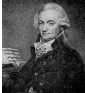
Johann Peter Salomon (1745–1815) Geiger, Komponist, Dirigent und Musikimpresario

den Mund, um den jeweiligen Gegner zu diskreditieren.