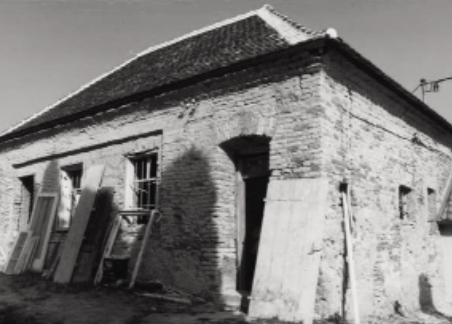
Geburtshaus – Birthplace