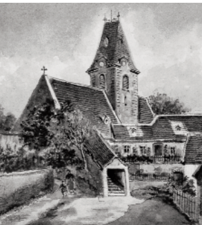
Pleyels Taufkirche mit seinem Geburtshaus in Ruppersthal/NÖ, Niederösterreichische Landesbibliothek, topografische Sammlung

Pleyel's Funeral Symphony on the death of the Holy Roman Emperor Joseph II Ben 142 (1790) in four movements presents a very different side of the composer. It was first recorded by the IPG on 9 November 2002 in Pleyel's baptismal church in Ruppersthal.