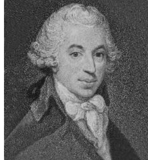
Ignaz Joseph Pleyel (1757–1831), Gemälde von Thomas Hardy (1757–1805)

He was a man of small stature with a diminutive head, an irascible temper and dark, fiercely intelligent eyes that lit up whenever he talked about his teacher Joseph Haydn or his admirer Wolfgang Amadé Mozart. The Allgemeine musikalische Zeitung described him as a man of bold