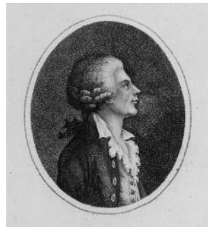
Jugendbidnis Ignaz Joseph Pleyel

Pleyel verstand es den Anforderungen des Streichquartetts gerecht zu werden – nicht zuletzt deshalb wurde er als der „bekannte Wiener Quartettenkomponist“ bezeichnet. Insgesamt schrieb er beachtliche 85 Quartette, davon 70 Streichquartette. Als Mozart Pleyels Streichquartette Opus 1 (Ben 301-306) entdeckte, die Pleyel seinem Förderer Graf Ladislaus Erdödy für „seine Grosszügigkeit, seine väterliche Unterstützung und seine Ermutigungen“ widmete, schrieb er sogleich seinem Vater Leopold am 24. April 1784 nach Salzburg folgenden Brief: