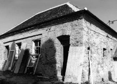
Geburtshaus – Birthplace