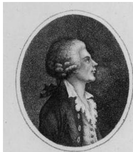
Jugendbildnis Ignaz Joseph Pleyel

1787 konnte man in Cramers Textauschnitten lesen: „[...] dass er sich wegen seines vorzüglichen und artigen Betragens überall sehr beliebt und gefällig gemacht hat und deshalb in den angesehensten Häusern Zutritt hatte und gerne gesehen wurde [...]“ Sein Lehrer und Konkurrent in London Joseph Haydn schrieb am 24. Dezember 1791 in sein Tagebuch: „Er zeugte sich bei seiner ankunft gegen mich so bescheiden, dass Er neuerdings meine liebe gewann [...]“ Seine Klaviermanufaktur zahlte den Arbeitern und Angestellten Arzt- und Apothekerrechnungen sowie Pensionen. Um schon fünfjährigen Kindern den Schulbesuch zu ermöglichen, ließ er in Paris Schulen und Kinderheime bauen.