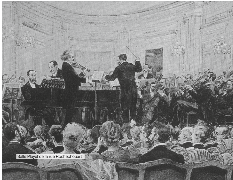
Salle Pleyel de la rue Rochecouart