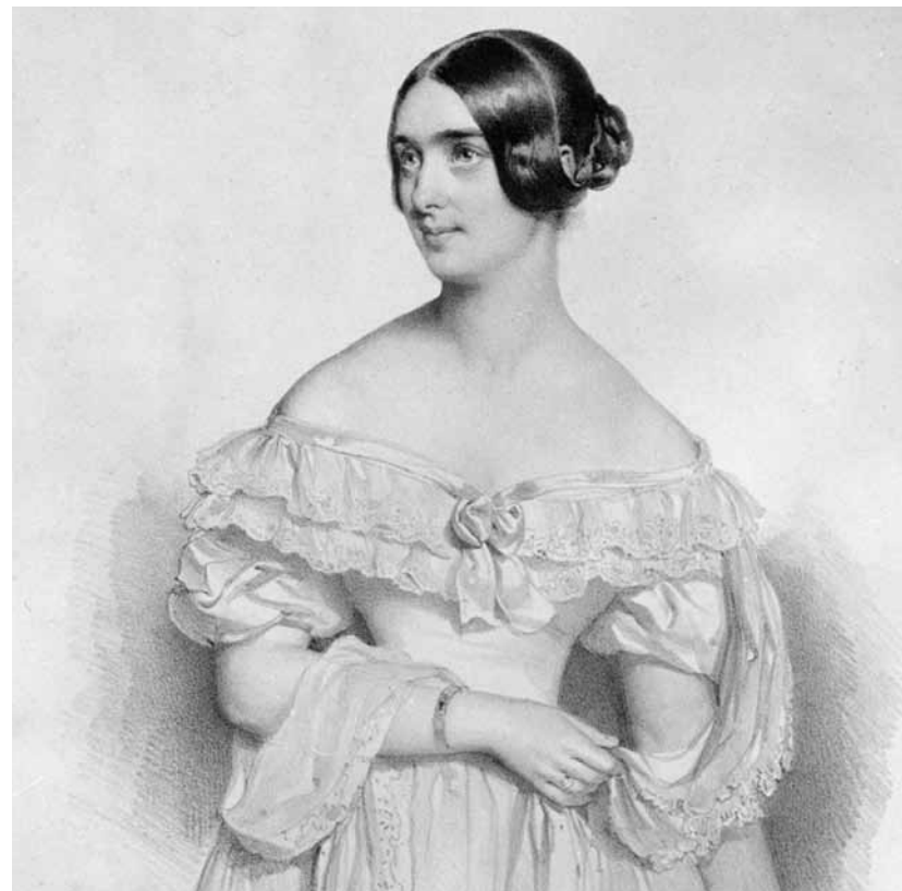
Camille Pleyel, Marie Pleyel