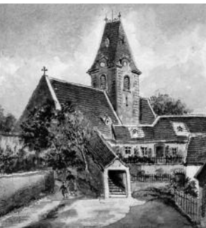
Pleyel's Taufkirche mit seinem Geburtshaus in Ruppersthal/NÖ, Niederösterreichische Landesbibliothek, topografische Sammlung

The premiere of Pleyel's opera Ifigenia in Aulide took place on the name-day of its patron, Ferdinand IV of Naples, in 1785. The dramma per musica was performed a further eighteen times