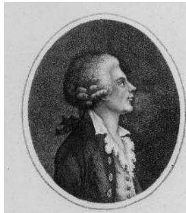
Jugendbidnis Ignaz Joseph Pleyel

1787 konnte man in Cramers Textauschnitten lesen: „[...] dass er sich wegen seines vorzüglichen und artigen Betragens überall sehr beliebt und gefällig gemacht hat und deshalb in den angesehensten Häusern Zutritt hatte und geme gesehen wurde [...]“ Sein Lehrer und Konkurrent in London Joseph Haydn schrieb am 24. Dezember 1791 in sein Tagebuch: „Er zeugte sich bei seiner ankunft gegen mich so bescheiden, dass Er neuerdings meine liebe gewann [...]“ Seine Klaviermanufaktur zahlte den Arbeitern