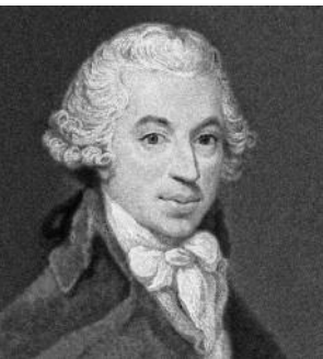
Ignaz Joseph Pleyel (1757-1831) – Gemälde von Thomas Hardy (1757-1805) koloriert von Thomas Hardy, Punktierstich von Johann Neid

Having made a fortune during his London visit, Pleyel returned to Strasbourg on 16 May 1792. Later that same month he met and befriended Rouget de Lisle, the purported author of the Marseillaise, although its authorship remains a matter of controversy today. Pleyel himself – the aristo-protégé, former maître de chapelle and compatriot of the already condemned Marie-Antoinette – undoubtedly drew the suspicions of the revolutionaries: to them, he could only be an "enemy of freedom." The guillotine was well-oiled, church services had been abolished, and the office of maître de chapelle was now fading into history. Pleyel was arrested and incarcerated in the prison of the Grand Séminaire. His eight-hour-long revolutionary cantata Le Tocsin allégorique Ben 706 made him a persona non grata in his country of birth whilst winning him third rank on a list published in 1796